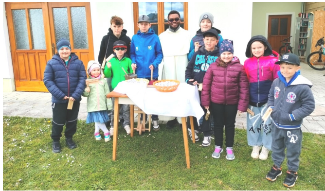
Zwei Gruppen begeisterter Ratschenkinder waren in Föhrenau unterwegs.