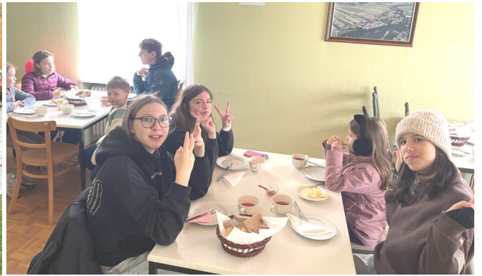
Fast alle der 31 Ratschenkinder aus Katzelsdorf nahmen das Angebot des Frühstücks im Pfarrhof gerne an.