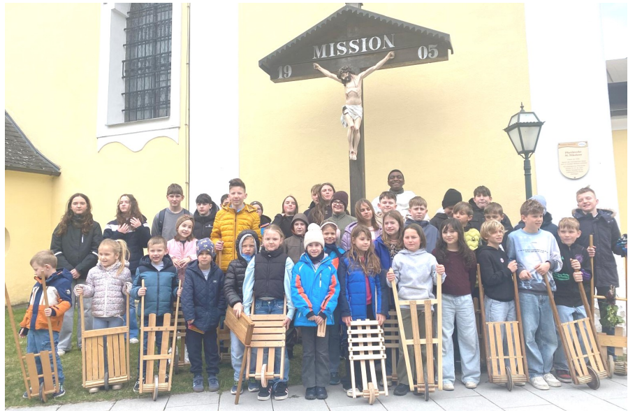
Rund 50 motivierte Kinder zogen in Lanzenkirchen mit ihren hölzernen Ratschen durch die Straßen.

Ratschen ist ein Dienst, der Ausdauer erfordert, sind die Kinder, egal bei welchem Wetter, doch dreimal täglich unterwegs. Dafür gebührt allen Ratschenkinder sowie den Begleitpersonen ein herzliches Dankeschön.